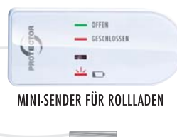
MINI-SENDER FÜR ROLLADEN