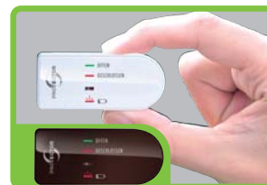
FENSTERSENDERGEHÄUSE ZUSÄTZLICH IN BRAUN BEIGEFÜGT