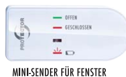
MINI-SENDER FÜR FENSTER