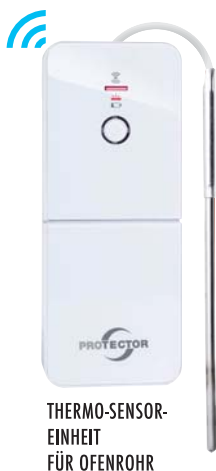
THERMO-SENSOR-EINHEIT FÜR OFENROHR