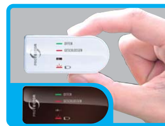
FENSTER SENDEGERÄHE ZUSÄTZLICH IN BRAUN BEIGEFÜGT