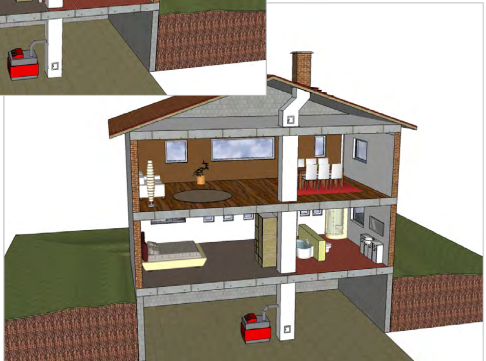
gezogener und gerader Schornstein mit 2. Reinigung unterhalb des Daches